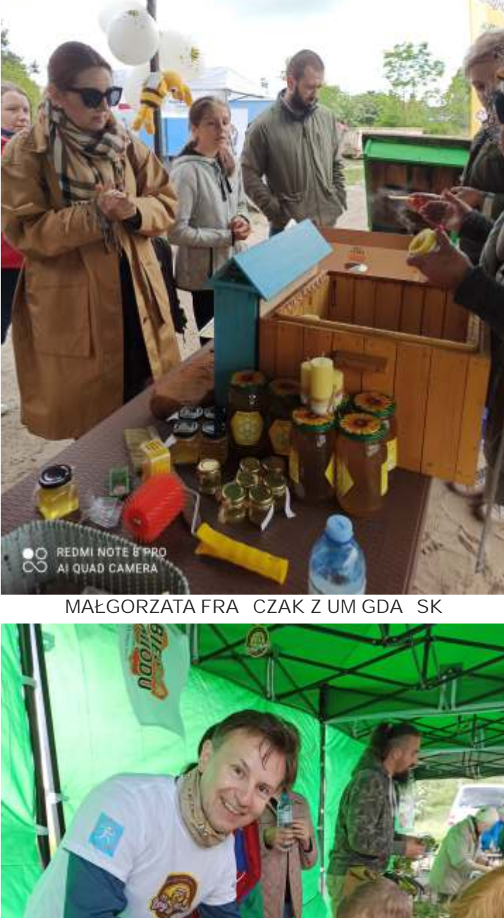
MIÓD NA ZDROWIE