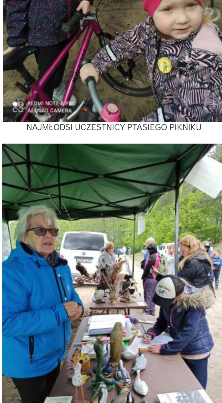
NAJMEODSI UCZESTNICY PTASIEGO PIKNIKU