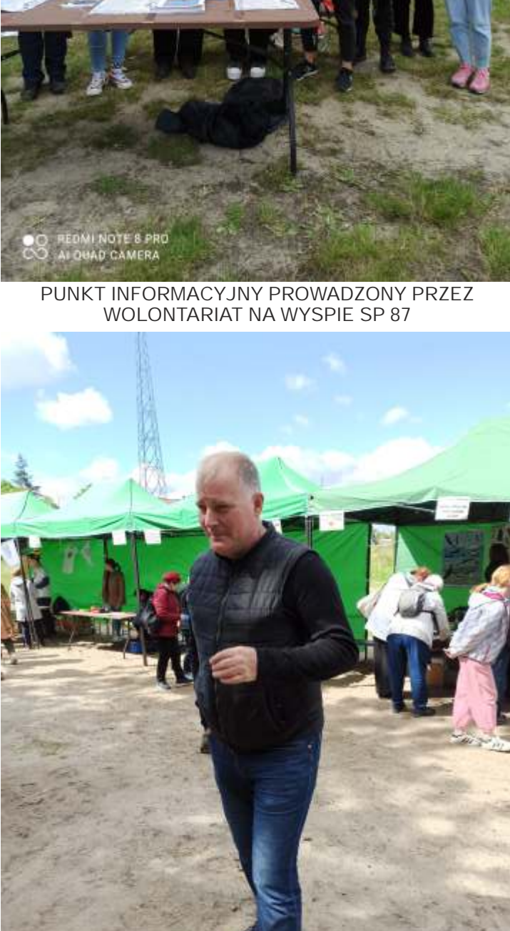
PUNKT INFORMACYJNY PRZEWODZONY PRZEZ WOLONTARIAT NA WYSPIE SP 87