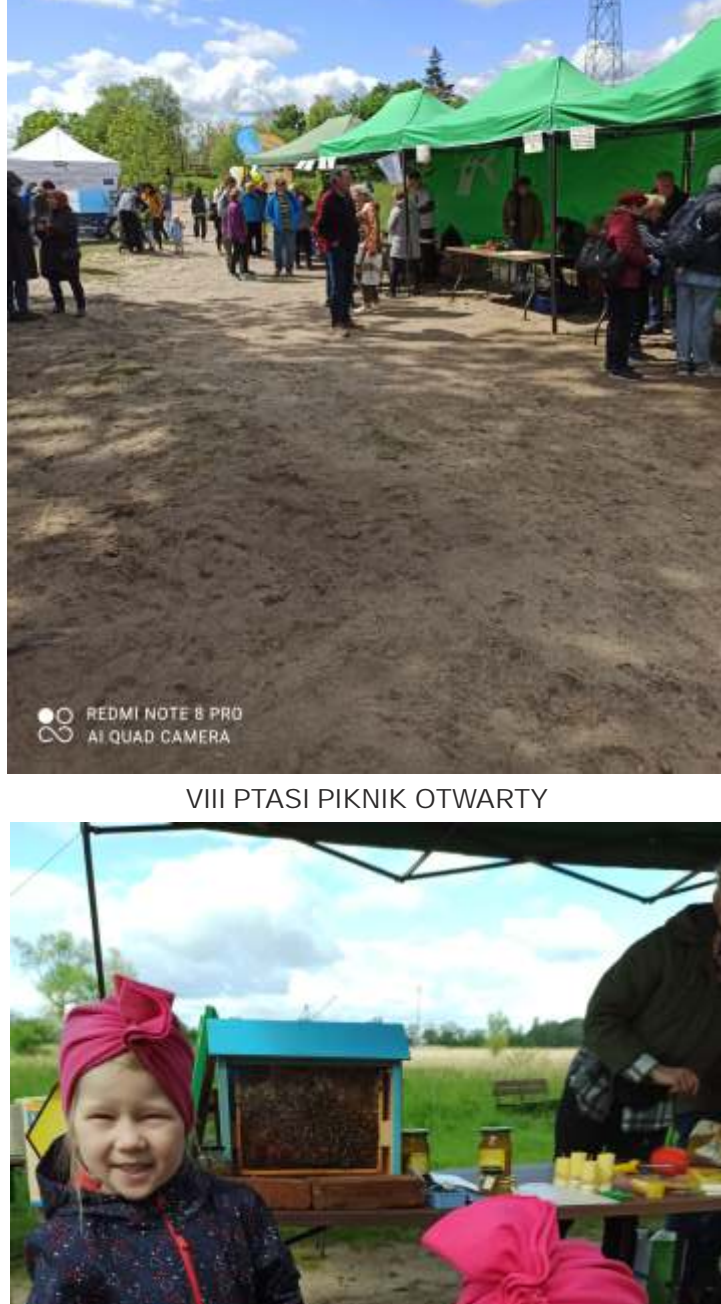
VIII PTASI PIKNIK OTWARTY