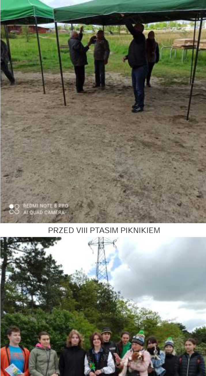
PRZED VIII PTASI PIKNIKIEM