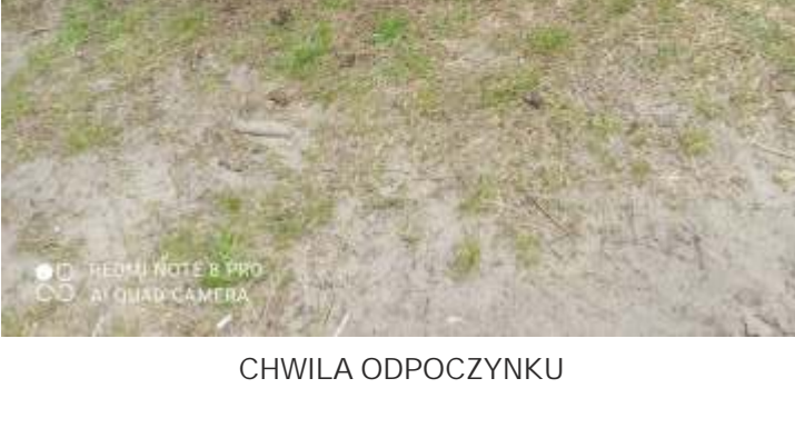
HOTELIKI DLA OWADÓW