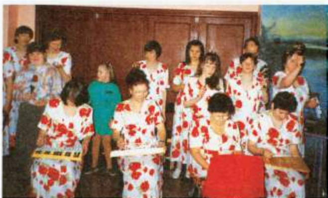
występ Zespołu „Tacy Sami”