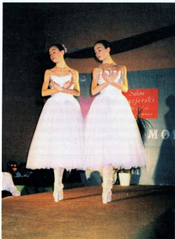
Za najładniejsze uważają pokazy sukien ślubnych. Modelkami jak narazie nie pragną zostać. Miesiąc kwie-