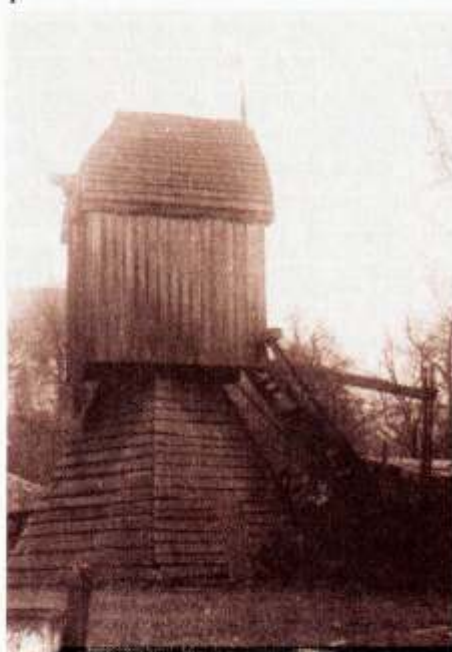
Wiatrak na terenie Zespołu Klasztornego Cystersów w Oliwie