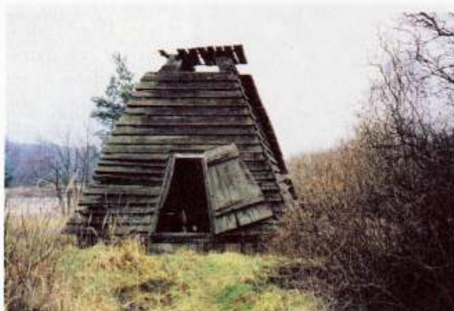
Stan wiatraka w 1997 roku, aktualnie zabezpieczony

W tym czasie stan obiektu był zatrważający. W Urzędzie Miasta brakowało dokumentacji z przeniesienia pozostałości ocalałej części wiatraka. Korespondencja urywała się na etapie ustalania lokalizacji. Na mapach wła-