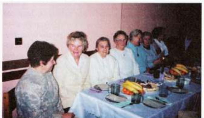
uczestniczki spotkania oplatkowego