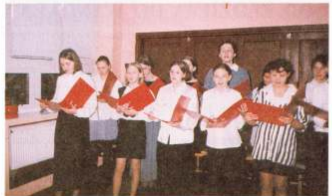
występ Chóru ze Szkoły Podst. nr 87