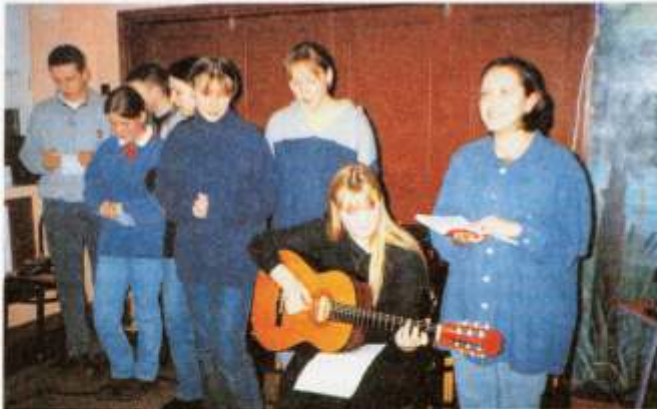
występ Młodzieży Oazowej

Już tradycją stały się w Parafii Sobieszewskiej spotkania oplatkowe osób starszych i samotnych organizowane w okresie Bożonarodzeniowym przez Parafial-